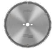
Piły ALUEX -Cleaning PVC- do usuwania wypływek, czyszczenia naroży PVC