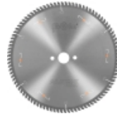
Piły ALUEX -Chamfering PVC- do fazowania listew przyszybowych