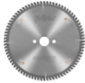
Piły SFALUEX WB+15° do cięcia profili okiennych PVC z uszczelką gumową