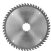
Piły serii POWER PLUS 1 -CHIPBOARD- do pilarek ręcznych