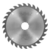
Piły serii POWER PLUS 2 -WOOD- do pilarek ręcznych