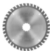
Piły serii POWER PLUS 3 -UNIVERSAL- do pilarek ręcznych