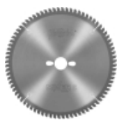
Piły serii MITER 2 -WOOD- do ukośnic